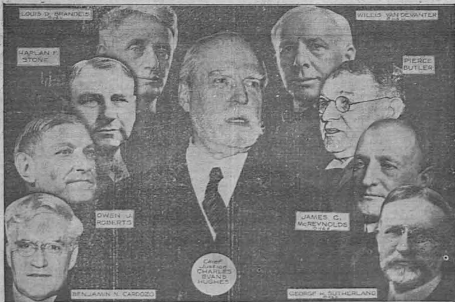
Estos nueve miembros de la corte suprema de justicia de los Estados Unidos dictarán mañana el fallo sobre pago de deudas en oro. Toda la nación espera este trascendental decisión. La corte está formada así: Cuatro liberales: jueces Cardozo, Roberts, Stone y Brandeis. Cuatro conservadores: Butler, Mc Reynolds, Van Devanter y Sutherland. Al centro, el presidente de la corte Charles Evans Hughes. Las opiniones de estos señores determinarán la suerte del New Deal, del presidente Roosevelt en muchos de sus aspectos.