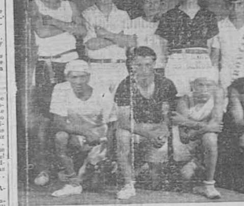
Aquí están, lector, los doce muchachos que iniciaron en la tarde de ayer la brutal prueba maratónica de San José-Pantareñas...