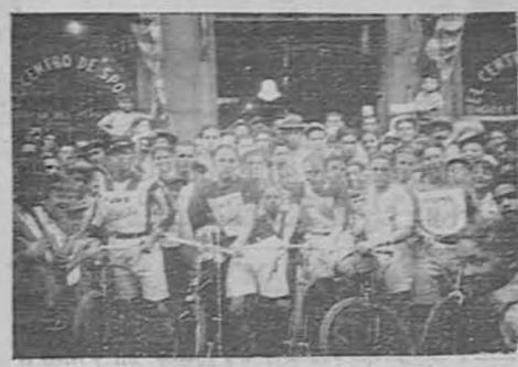
El grupo de ciclistas que ayer iniciaron el raid San José-Pantareñas, ante la cámara del DIARIO.