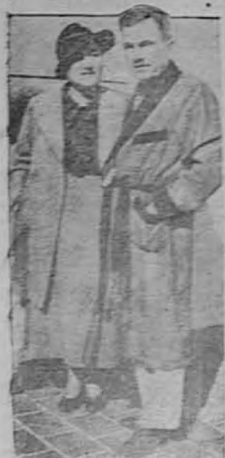
El general Plutarco Elías Colles, ex-presidente de México, en un momento de su jira de exhibición que fue efectuada con gran éxito. A su lado, la señora Elena de Terra Blanco, una de sus hijas.